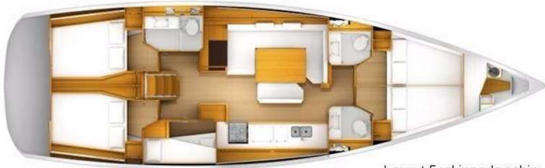
Layout 5+skipper's cabin